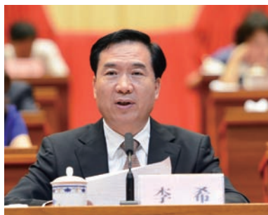
遼寧省委書記李希在省第 9 次歸僑僑眷代表大會上講話。