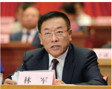
中國僑聯主席林軍在遼寧省第 9 次歸僑僑眷代表大會上講話。