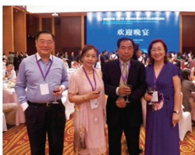
美國洛杉磯僑商在歡迎晚宴現場。