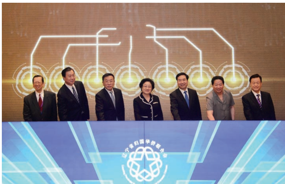
創業中華 2015 世界知名僑商遼寧行啟動儀式。

李希表示，我們將牢固樹立尊商、敬商、親商、愛商意識，為僑商投資興業創造更加良好的生產生活條件、宜居宜業環境。