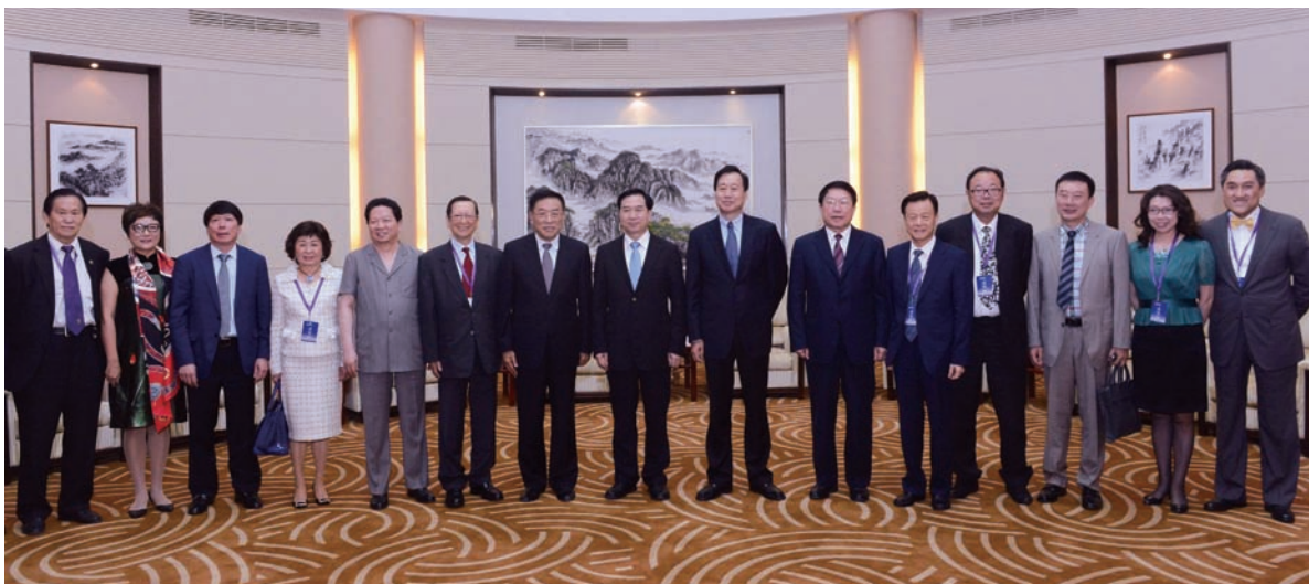
遼寧省委書記李希省長陳求發省政協主席夏德仁會見中國僑聯主席林軍及僑商代表。