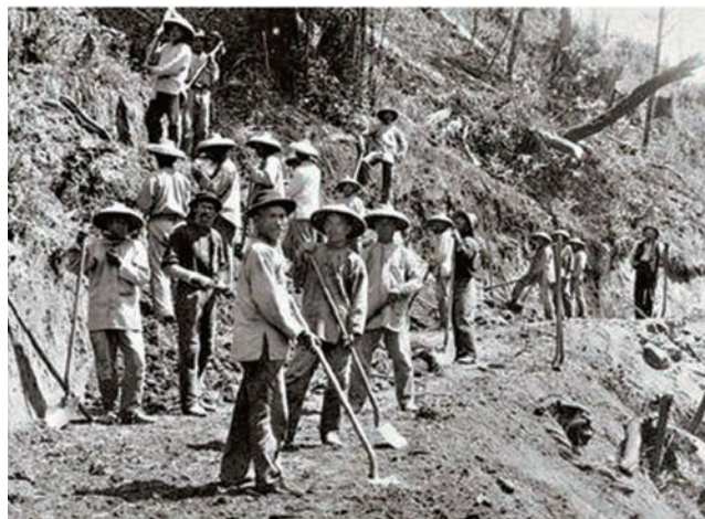
19世紀美國鐵路華工

華裔的勞工部副部長盧沛寧說，身為移民後代，他個人十分感動，也花不少時間去了解當年歷史。華裔在美國社會的成就比過去好很多，但貧窮仍然存在，身為歐巴馬政府的勞工部官員，改善勞工工作環境是他主要的工作。