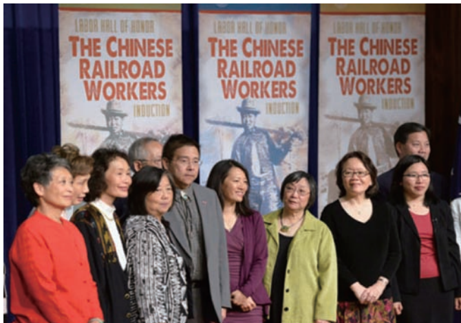
鐵路華工後人代表出席紀念儀式