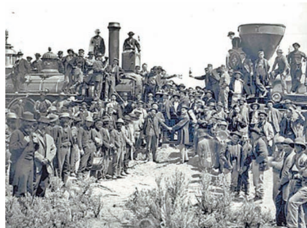
美國東西鐵路通車儀式上並沒有華工身影