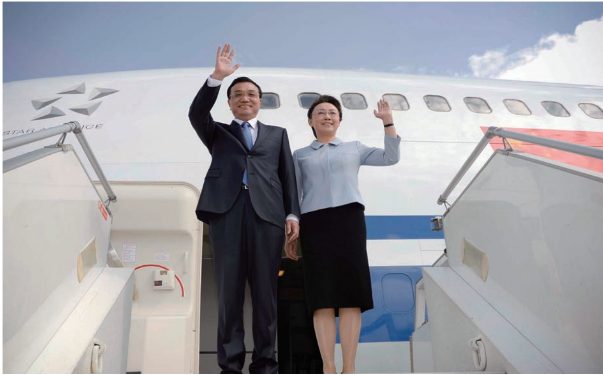
中國總理李克強及其夫人程虹